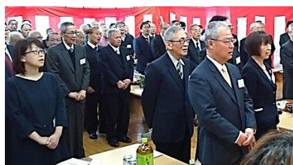
「国歌」と「1月1日」を斉唱