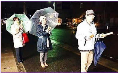
本庄中二丁目町内会の夜警