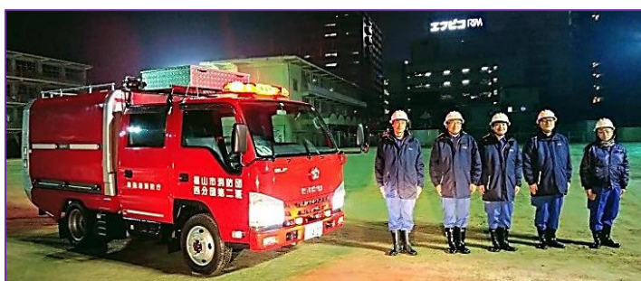
12/29(日)西分団第2班夜警 西小集合出発