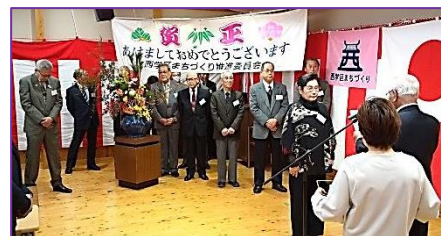
学区民賞受賞式典