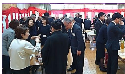
和気あいあいの歓談風景