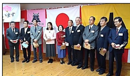
年男・年女の皆さま