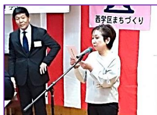
市民憲章の唱和先導