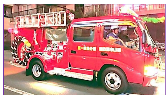
12/28(土)西分団第1班夜警 駅前巡回