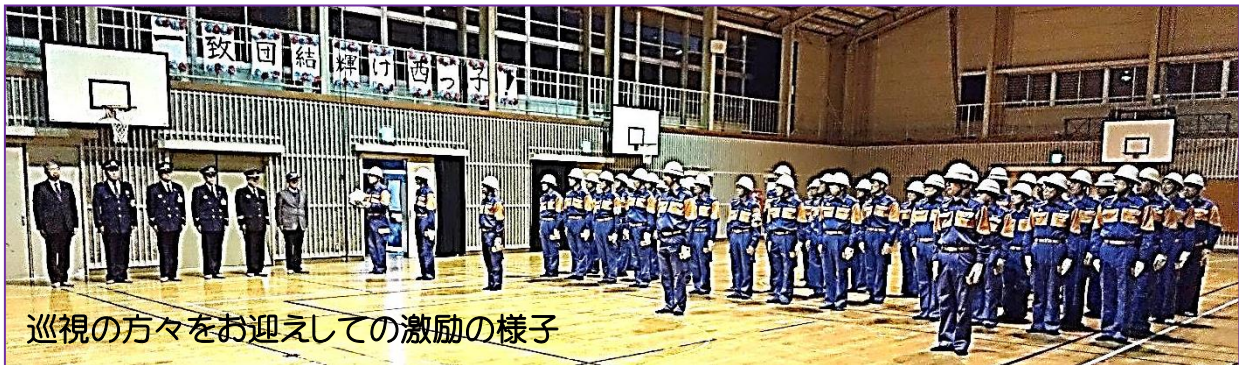
巡視の方々をお迎えしての激励の様子

◆巡視が始まる15分前には、消防団員全員が体育館中央に列をなして、市内の各方面隊を巡視する福山市長・東警察署長・福山市消防団長をお迎えしました。