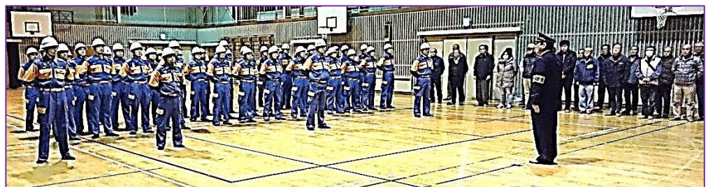
東警察署長による消防団員と地域支援者への挨拶

◆終りに当り29日まで事故なく無事に防火防犯の夜警が終了するように、互礼をしました。福山市の代表者は次の方面隊へ行かれました。